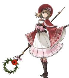
ルナリア＝シャウザー