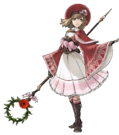
ルナリア＝シャウザー